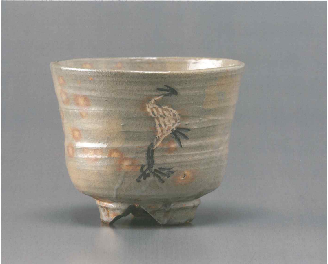
입학 찻사발 / 12cm × 10cm