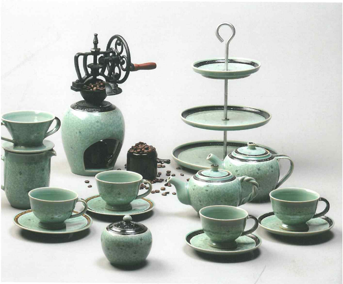
김경진 & 김보미 공동작