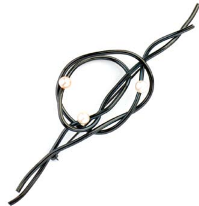
추 이 안 Choo I - An