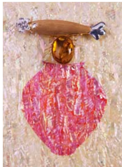
Flowers bloom 160x260mm Sterling silver, Gold, Amber, Mother-of-pearl 2014