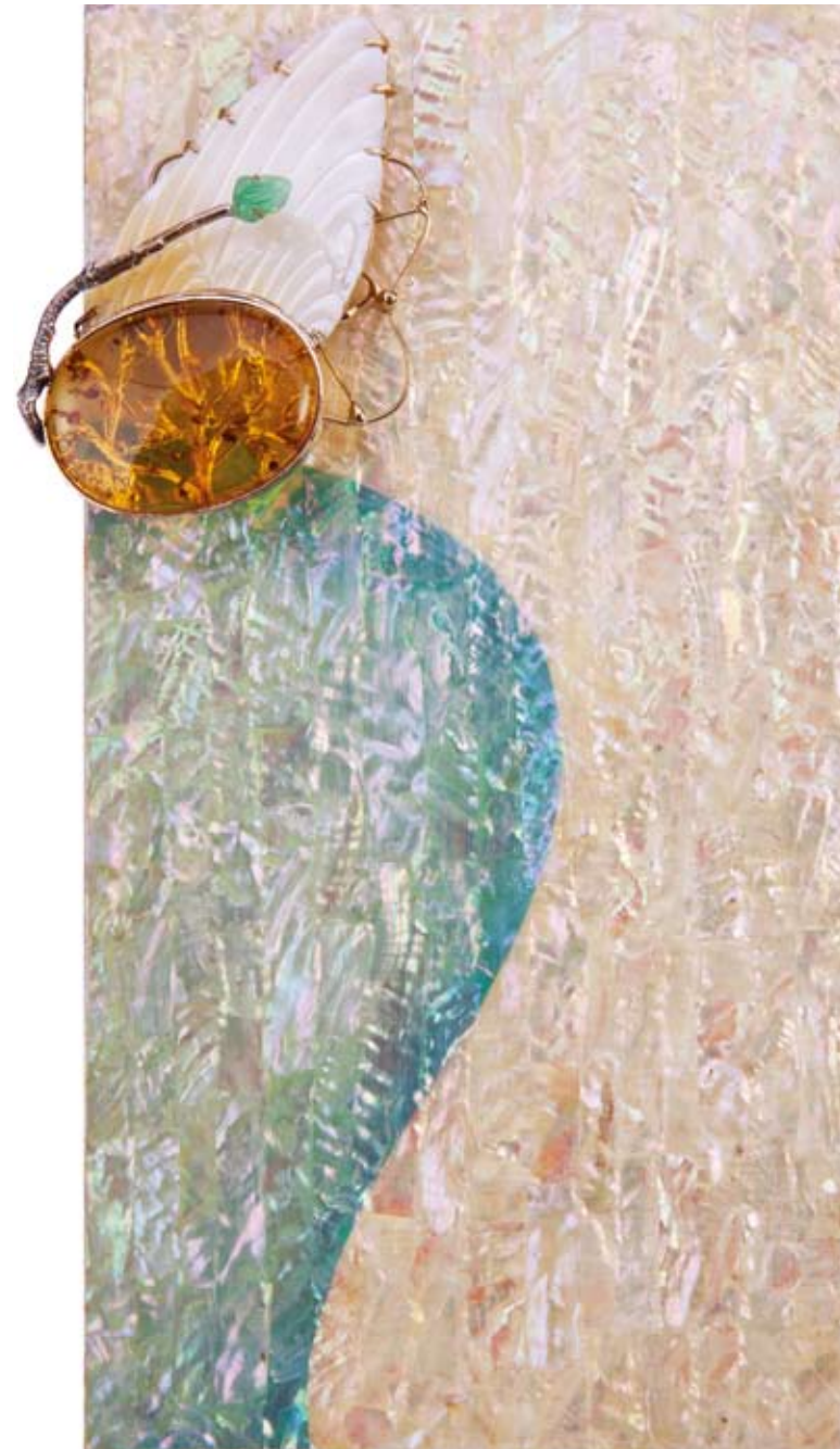
Flowers bloom 160x260mm Sterling silver, Gold, Amber, Mother-of-pearl 2014